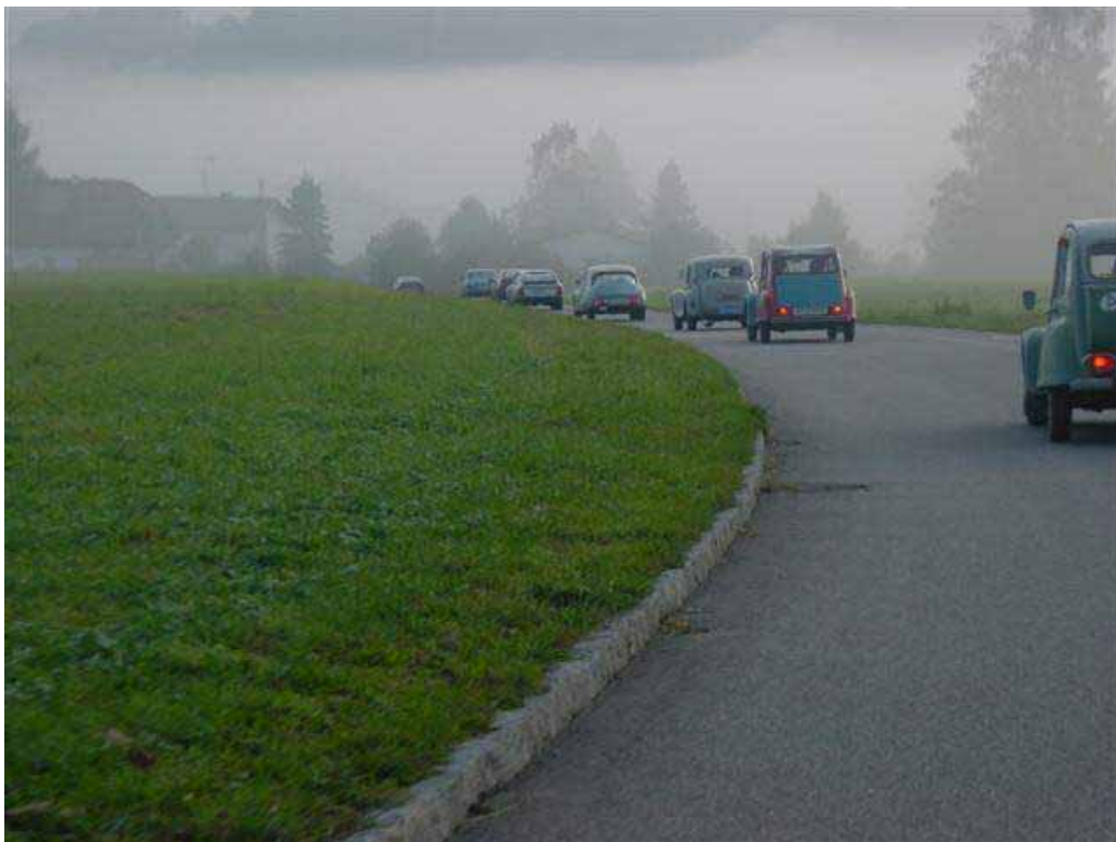
aufgenommen bei Herbstausfahrt, 28.09.03